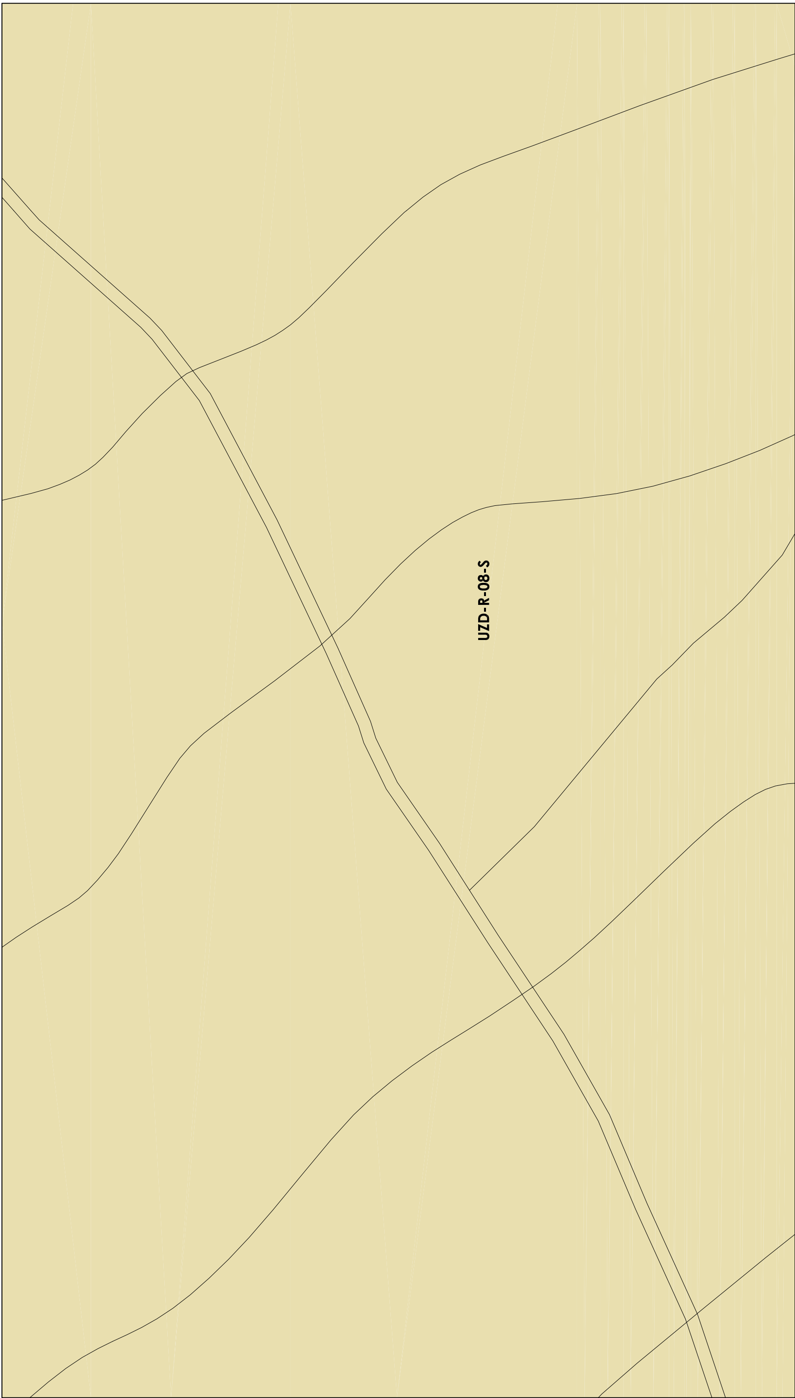
Distribución Hojas 1/10000