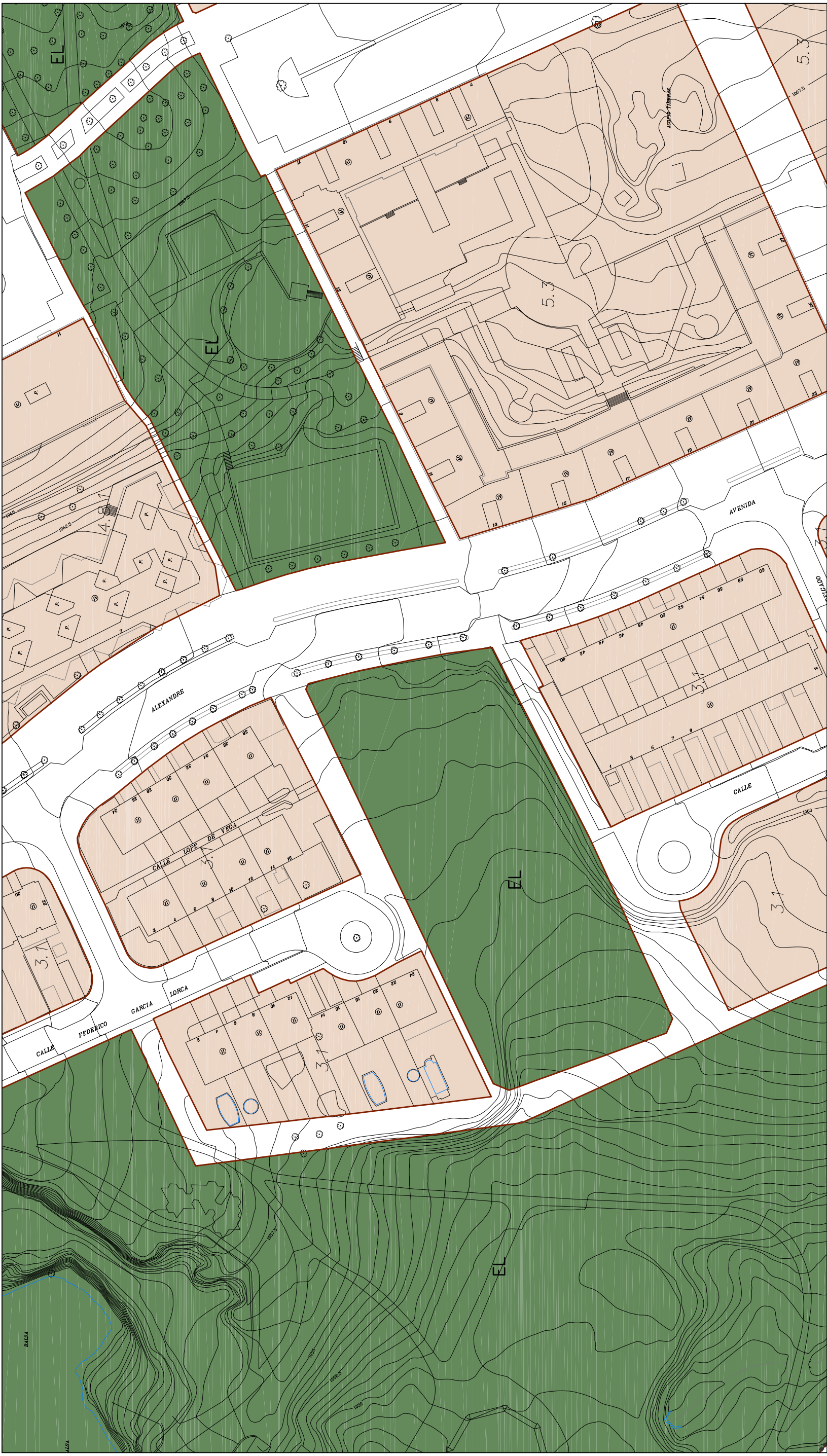
Distribución Hojas 1/10000