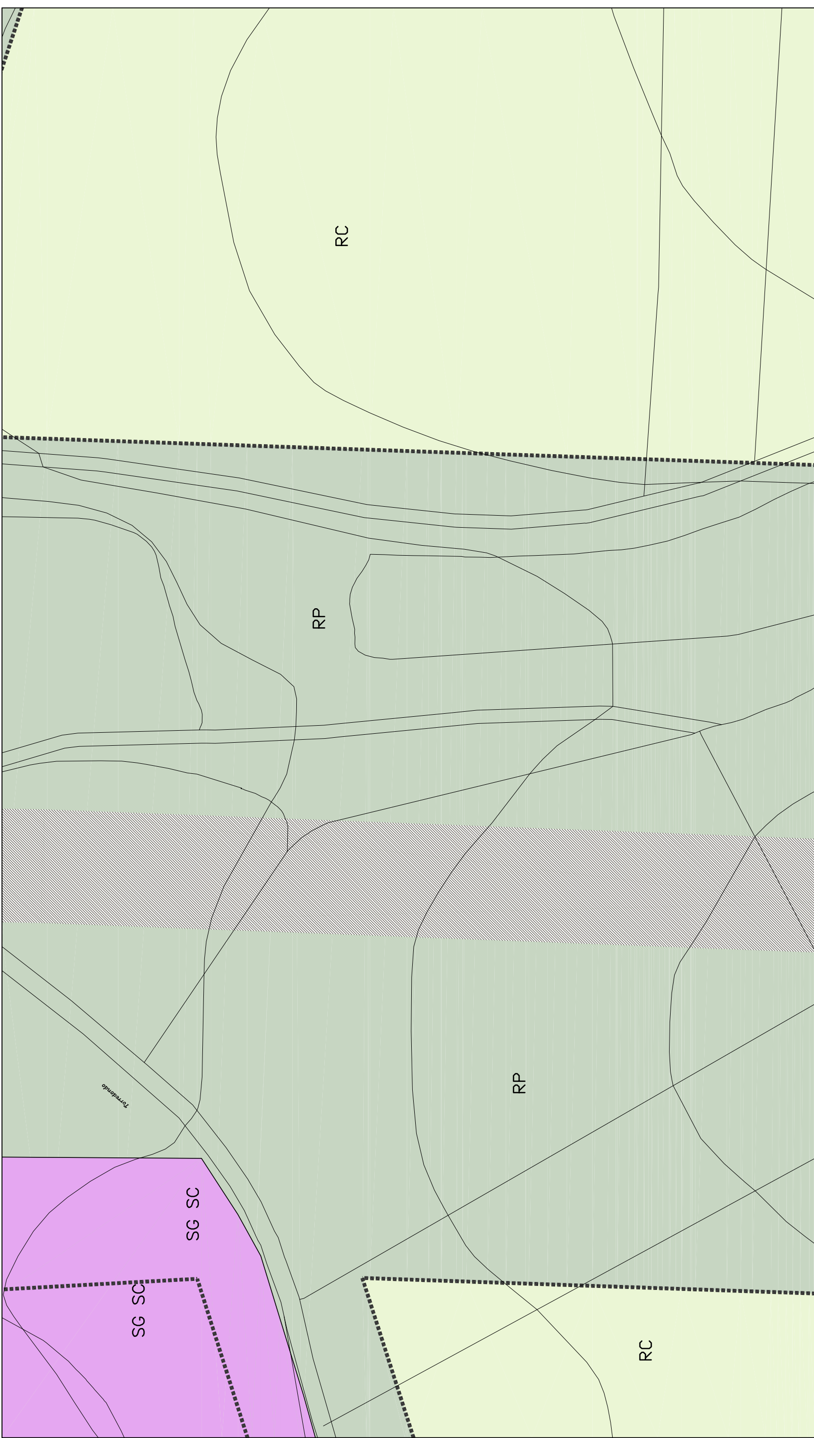
Distribución Hojas 1/10000