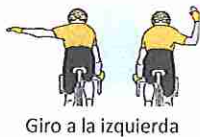
Giro a la izquierda