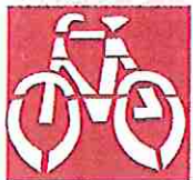
Marca de vía ciclista