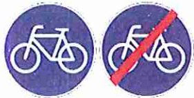
Vía reservada para ciclos Fin de vía reservada para ciclos