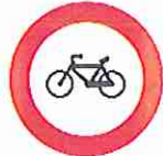
Entrada prohibida a ciclos