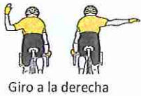
Giro a la derecha